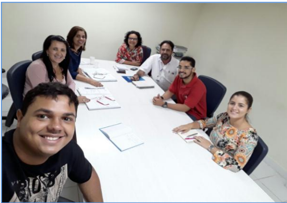
Reunião no Hospital Belarmino Correia

Apresentação das reuniões que foram realizadas até o mês de fevereiro: