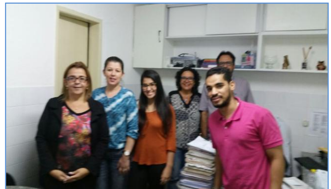
Reunião na Maternidade Jesus Nazareno