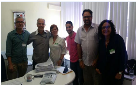
Reunião no Hospital da Restauração